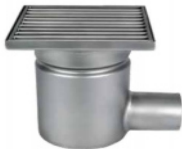
С выпуском DN 50