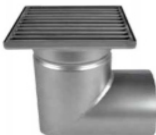
С выпуском DN 110