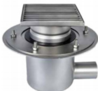
С выпуском DN 50