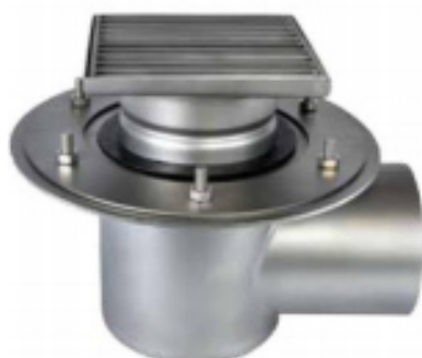
С выпуском DN 110