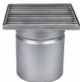
С выпуском DN 110