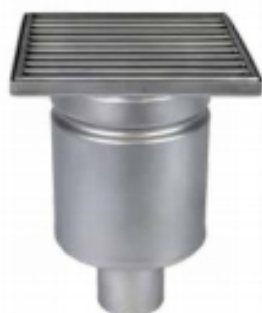
С выпуском DN 50