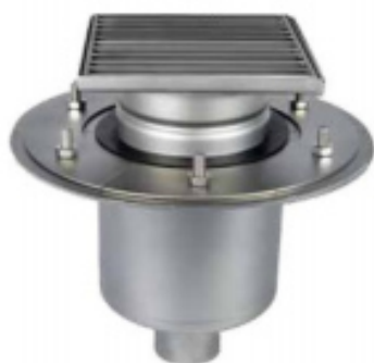
С выпуском DN 50