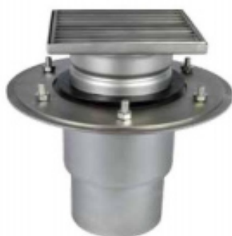
С выпуском DN 110